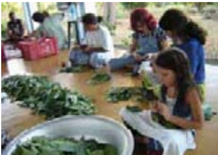
Limpeza das folhas – Feitio na Terra da Luz em Cascavel – CE – 08/2003.