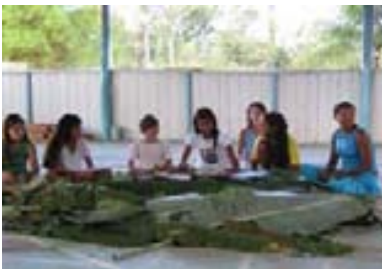
Crianças limpando folhas em feitio no Trono das Estrelas em Boca do Acre – AC – 06/2006 – Arquivo do autor.

MATEIROS: São aqueles que conhecem melhor a mata e sabem onde procurar e reconhecer o cipó em meio à grande variedade que existe na Amazônia. Essa procura pode durar vários dias. Trazem o cipó para a casa de feitio cortando em pedaços de aproximadamente 30 cm para facilitar a bateção. Nas casas de feitio urbanas, não existe essa função, pois os plantios já são planejados de forma a facilitar a colheita e também porque grande parte do Daime que é consumido nessas igrejas é oriundo da Amazônia.