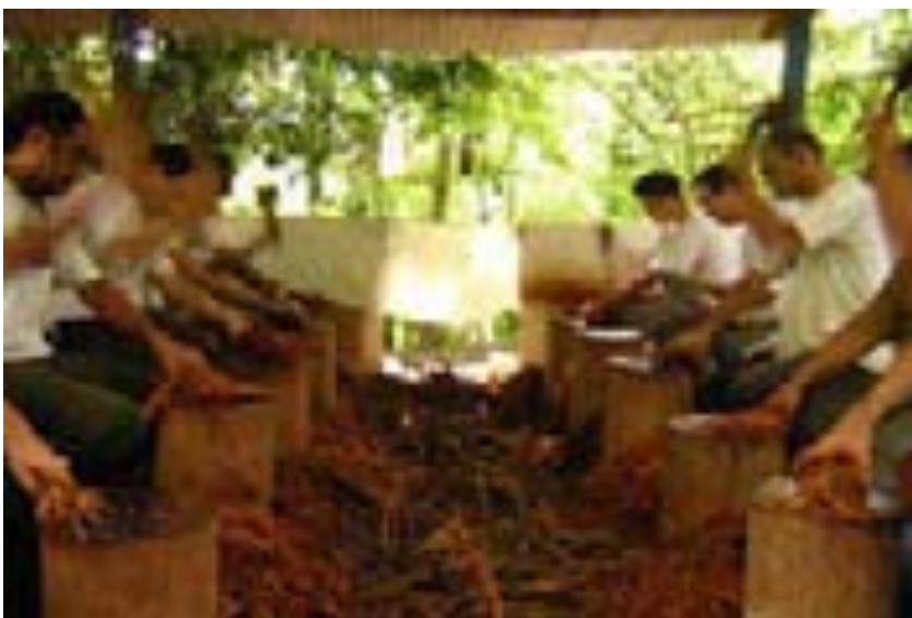
Bateção no Céu da Campina – Campina Grande –PB – fev/2004.