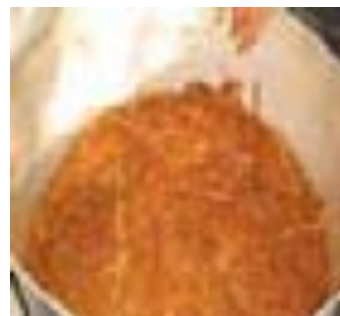
3ª camada - cipó