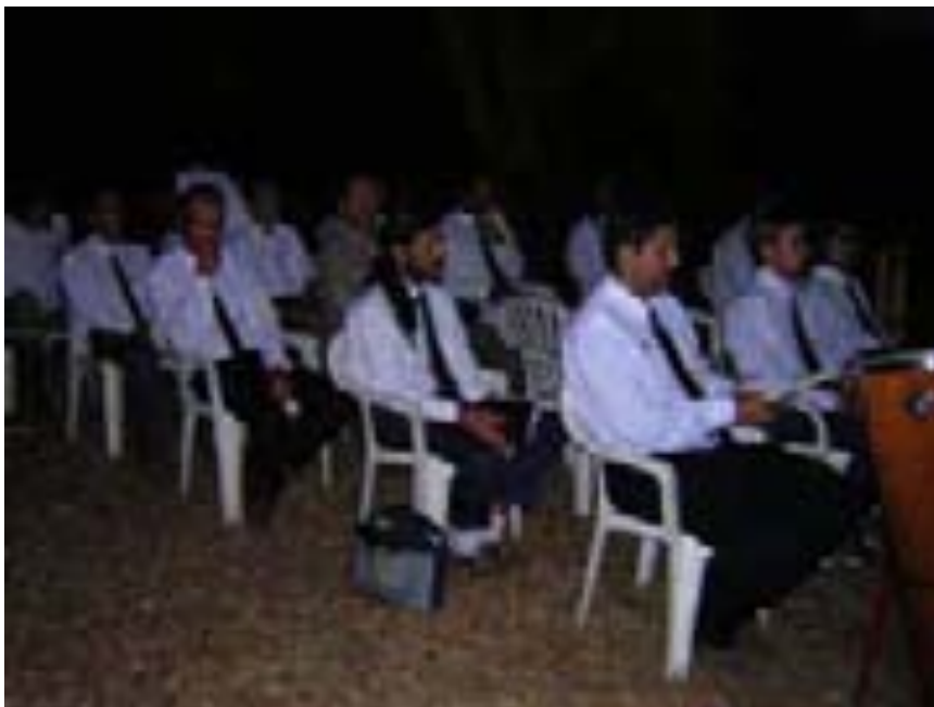
Batalhão masculino em um trabalho de concentração na Terra da Luz. Cascavel, Ceará.