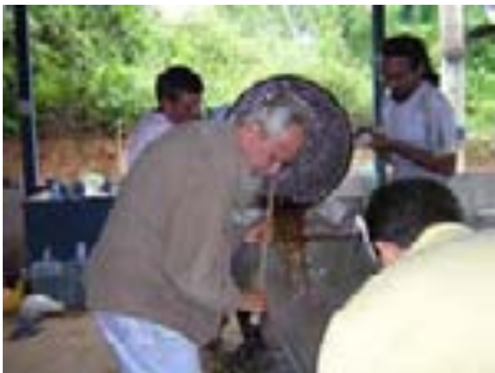
Feitio no Céu da Campina – Campina Grande – PB em 02/2004.