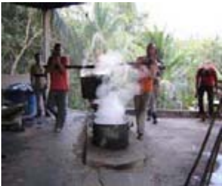
Feitio no Pronto Socorro Raimundo Irineu Serra – Rio Branco – AC – 07/2006.