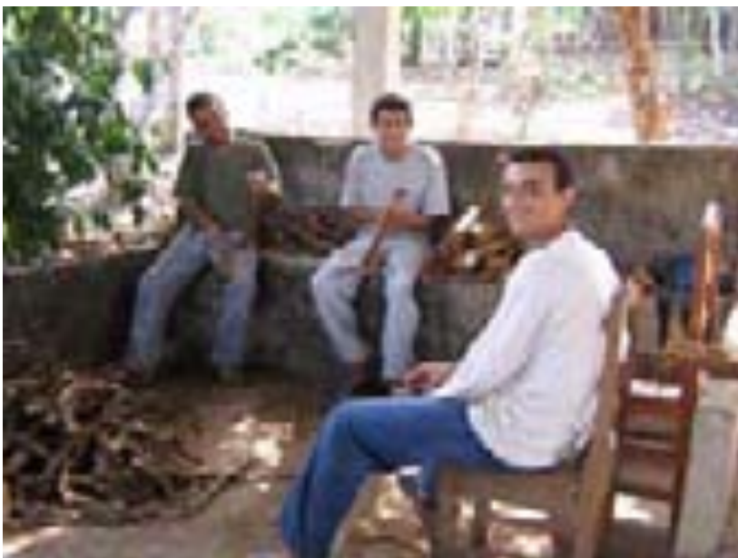
Raspação em feito no Pronto Socorro Raimundo Irineu Serra – Rio Branco – AC – 07/2006.