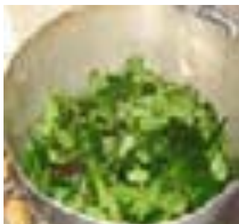
2ª camada - folha