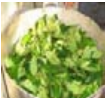
4ª camada - folha