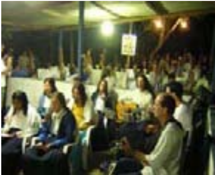
Trabalho de Cura – Feitió no Céu da Campina – Campina Grande – PB – 02/2004.

É comum se realizarem trabalhos – geralmente os de cura – na boca da fôrnalha, ocasião em que é permitida a presença das mulheres na casa de feitió.