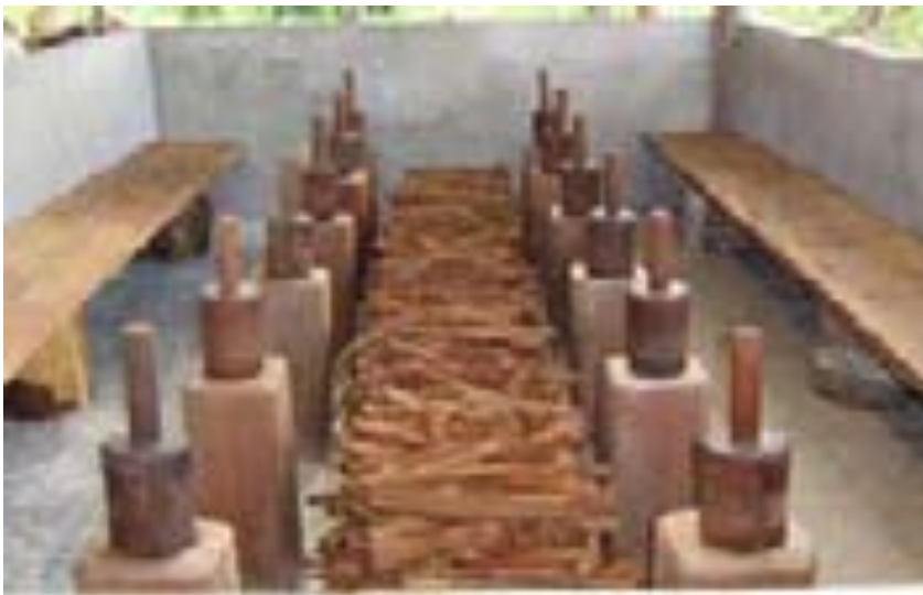
Sala de bateção Trono das Estrelas – Boca do Acre – Ac – 06/2006