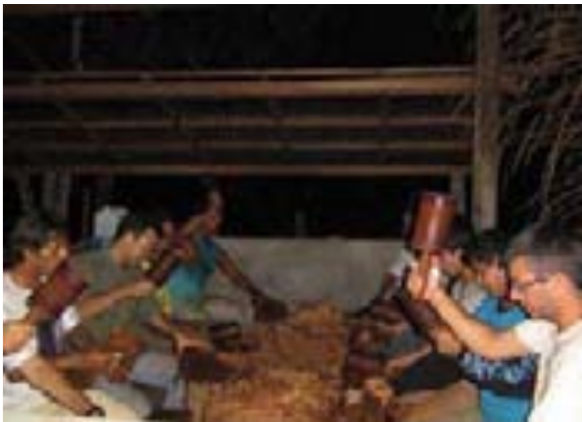
Bateção no Trono das Estrelas – Boca do Acre – AC – em junho/2006.

PANELEIROS: Depois de macerado (batido) todo o cipó e de montadas as panelas, começa o trabalho de retirada dos cozimentos. De hora em hora (mais ou menos), sai uma panela que de ser retirada pelos paneleiros e levada até a calha para que escorra o Daime. Cada panela pesa em torno de cento e vinte a cento e cinquenta quilos e os movimentos de retirada devem ser sincronizados para não derrubar a panela.