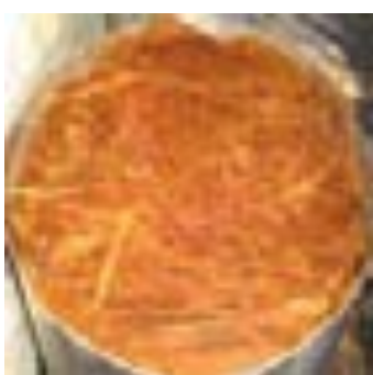
Última camada - cipó