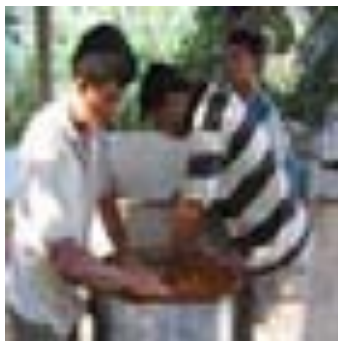
Término da montagem

São acrescentados ao material sessenta litros de água e retirados vinte litros de cozimento que depois são unidos a outros cozimentos. Quando se tem uma certa quantidade desses cozimentos, monta-se outra panela e coloca-se sessenta litros de cozimento (ao invés de água) e daí, finalmente se retira vinte litros de Daime. É um processo que exige muita concentração de um lado e muito preparo do corpo, de outro.