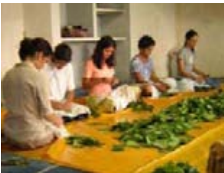
Limpeza das Folhas – Feitiço no Céu da Campina em Campina Grande – PB – 02/2004 – Arquivo do Autor.

LIMPEZA DAS FOLHAS: Realizada geralmente pelas mulheres, é um momento importante do feitiço – adstrita ser a única tarefa feminina –; as folhas devem ser limpas manualmente, uma a uma, numa atividade de concentração e introspecção, onde são refletidas a condição de cada uma naquele momento e também a sua purificação. É comum que se cantem hinos durante a limpeza das folhas e que as mulheres aproveitem esse espaço para se conhecerem melhor. Geralmente é realizada na igreja ou em local apropriado longe do movimento masculino. As mulheres menstruadas não podem participar da limpeza das folhas, fazendo parte da equipe que toma de conta da alimentação e limpeza.