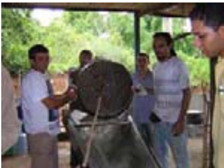
Feitio no Céu da Campina – Campina Grande – PB em 02/2004.