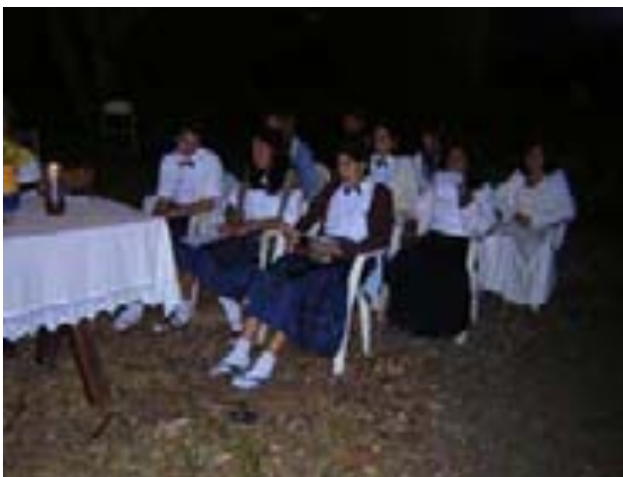
Batalhão feminino em um trabalho de concentração na Terra da Luz. Cascavel, Ceará.