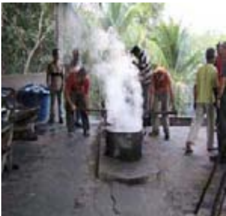
Feitio no Pronto Socorro Raimundo Irineu Serra – Rio Branco – AC – 07/2006.

PANELEIROS: Depois de macerado (batido) todo o cipó e de montadas as panelas, começa o trabalho de retirada dos cozimentos. De hora em hora (mais ou menos), sai uma panela que de ser retirada pelos paneleiros e levada até a calha para que escorra o Daime. Cada panela pesa em torno de cento e vinte a cento e cinquenta quilos e os movimentos de retirada devem ser sincronizados para não derrubar a panela.