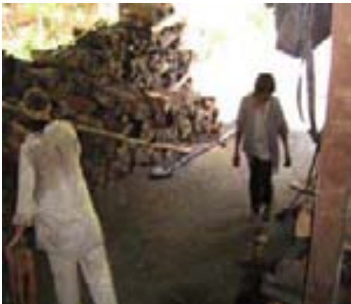
Foguitas em feíto no Céu do Mapiá – AM – em 06/2006.

Por fim o Daime é resfriado e posteriormente enlitrado e conservado: