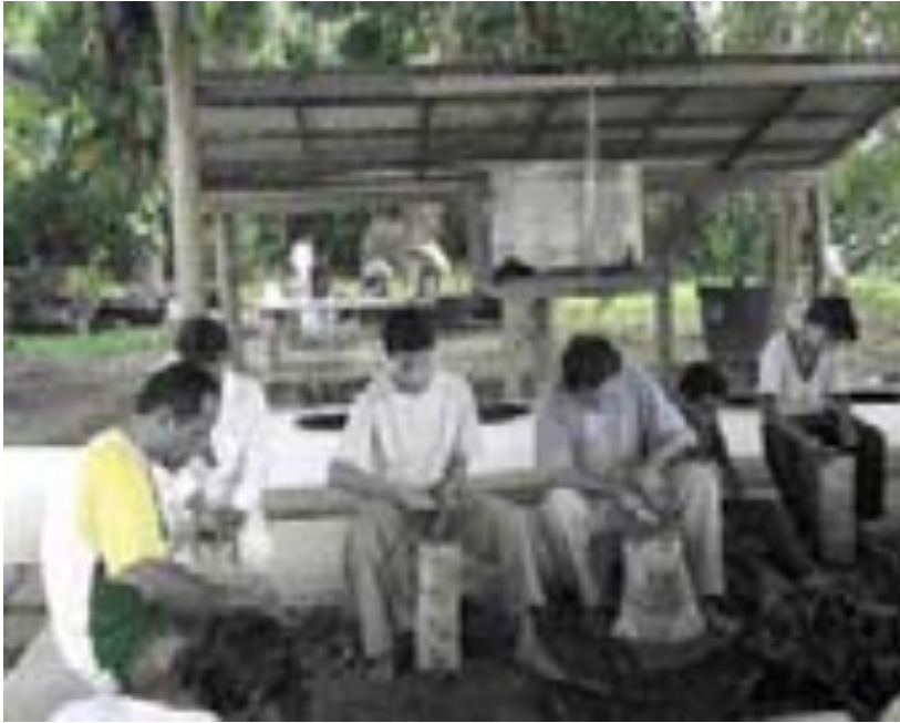
Raspação em feito no Trono das Estrelas – Boca do Acre – AC – 06/2006

RASPADORES DE CIPÓ: são responsáveis por limpar e raspar o cipó que vai ser batido. É uma atividade que requer cuidado para não se raspar muito e extrair a substância do cipó que se concentra na casca.