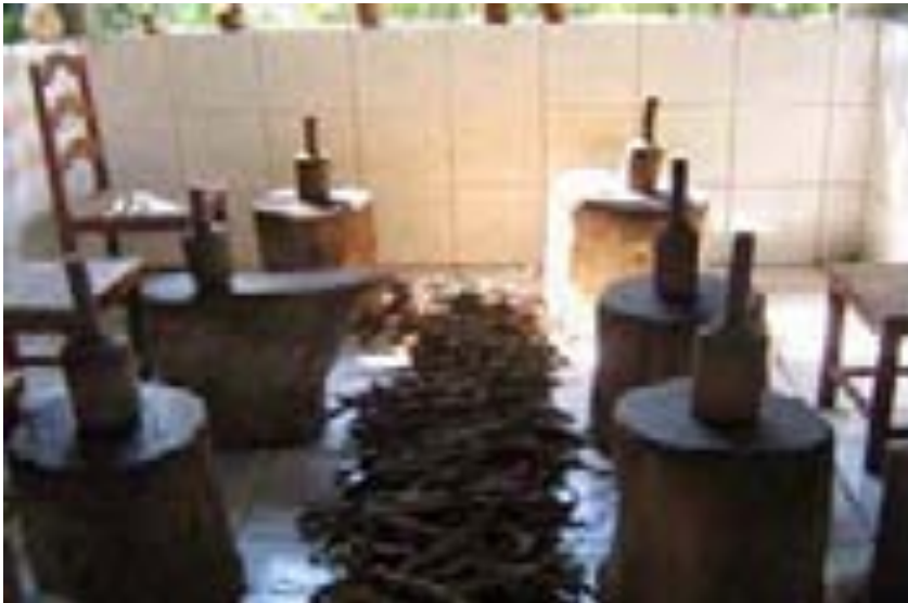
Sala de bateção Pronto Socorro – Rio Branco - Ac – 07/2006 – Foto do autor.