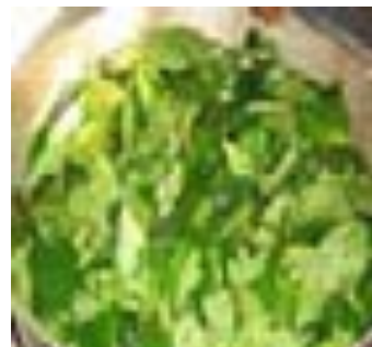
6ª camada - folha