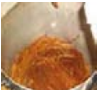
1ª camada - cipó

A seguir, a montagem de uma panela como é feita pela maioria dos feitores: